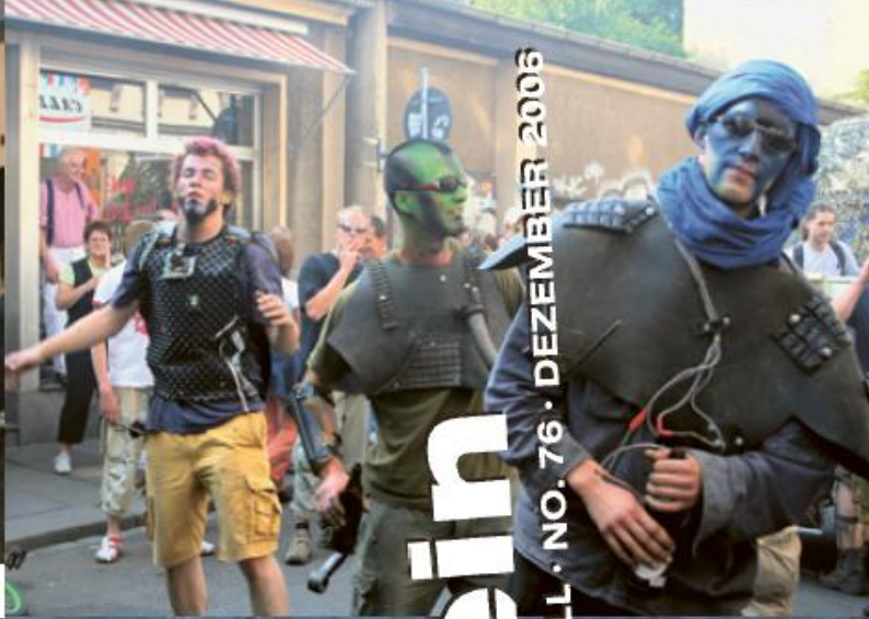
Auf der Suche nach der Zielgruppe