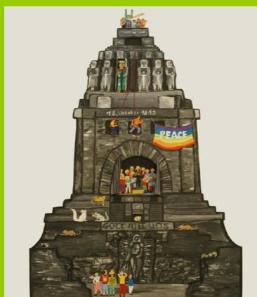
Teamarbeit des KINDER-ATELIERS / KAOS e.V.